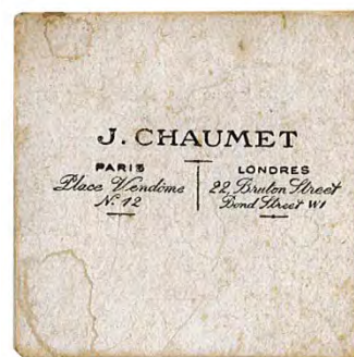
Boite de l'insigne