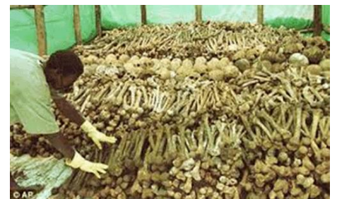
Des montagnes de crânes et d'ossements un peu partout dans le pays donnent le vertige

Richard ZIELINSKI (ER) La vieille suspenne de l'EPI