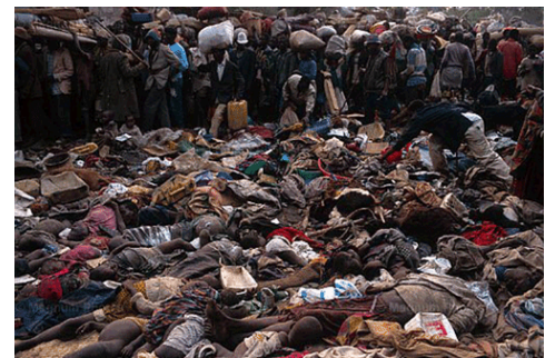
Les paramilitaires HUTUS responsables du génocide rwandais et un charnier, des survivants hagarés tentent d'identifier des proches.