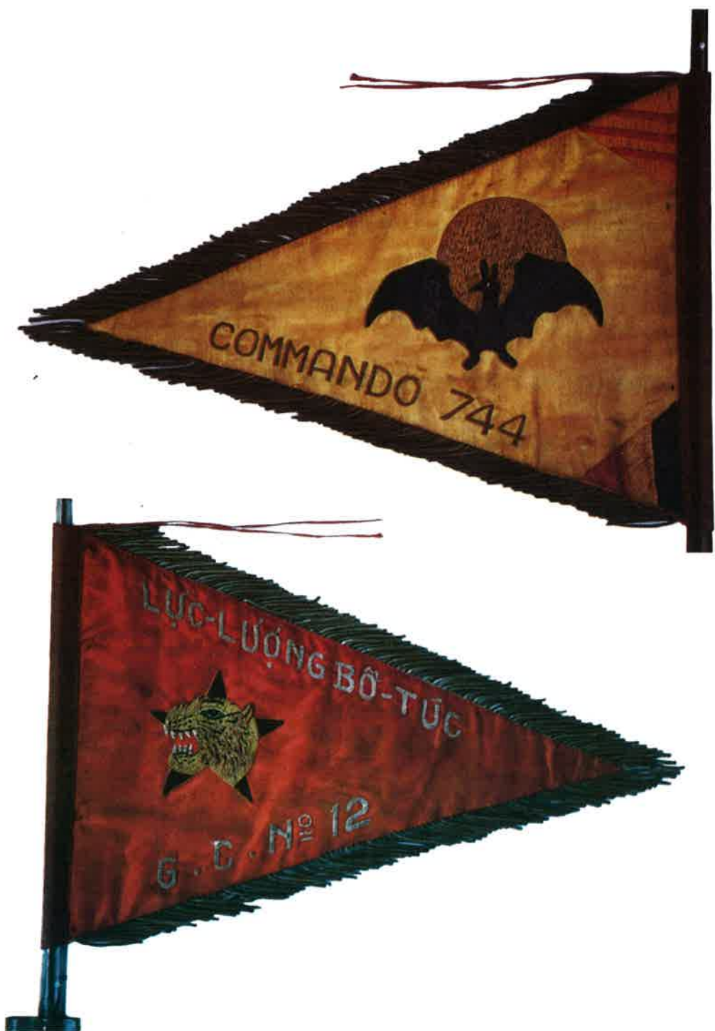
Dimensions du fanion du commando 744 Hauteur : 30 cm - Longueur : 47 cm