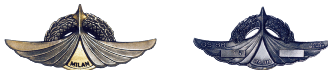
Fig. 2 Brevet du Lieutenant-Colonel René BON. N° 1004