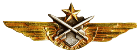
Fig. 5. Observateur Tireur de Missiles Antichars GS 42 (Sous-Officier).

Ces insignes ne sont plus en service. (Voir les insignes GS 83 et GS 84).