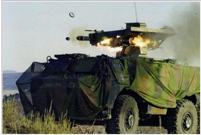
Vab - Tir HOT