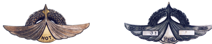
Fig. 3 Brevet du Lieutenant-Colonel René BON. N° 3

Homologué le 25 mars 1987, sous le N° GS 86. Fabricant : Beraudy.