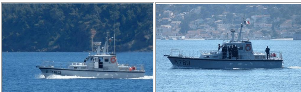
Superbes clichés de Norbert BOURHIS du Mélia avec son équipage, patrouillant le long des côtes Varoises